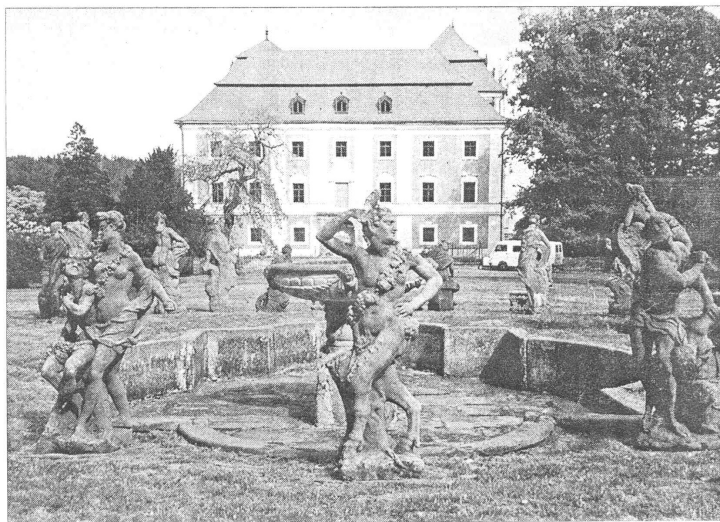
Státní zámek Valeč se zbytky soch Matyáše Brauna (původně jich bylo třicet)

Dnes má Valeč spolu s okolními obcemi 380 obyvatel. Z nich asi padesát zde také má práci. Ostatní jezdí za výdělkem do Varů, do Prahy, nebo kam se dá. Většina pracuje ve stavebnictví. „Je vlastně zá-